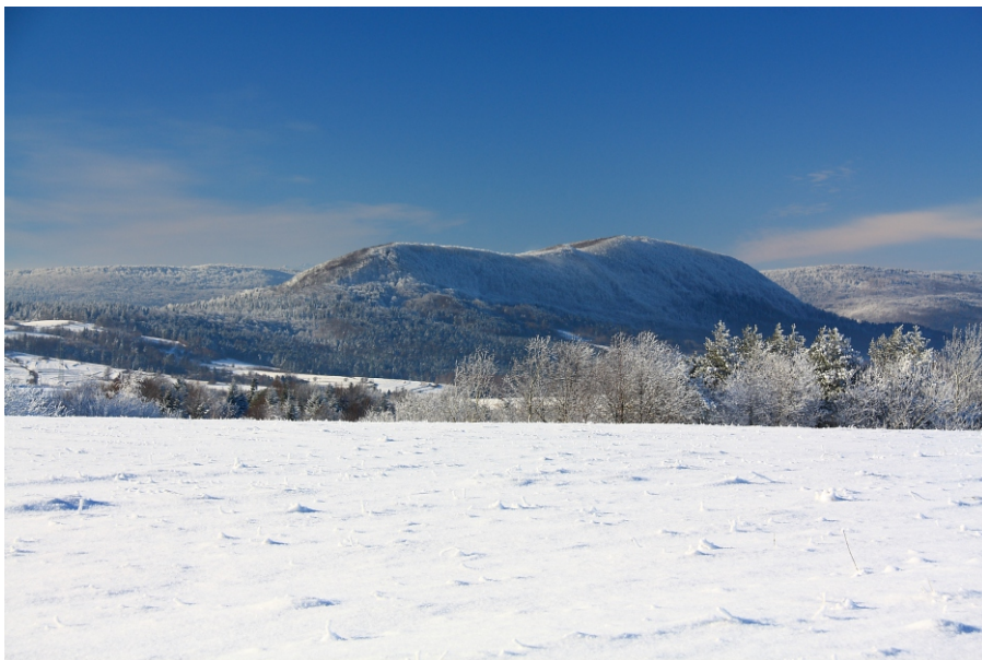
Cergowa - widok z Przymiarek

Cergowa wznosi się na południowy wschód od Dukli, w środkowej części Beskidu Niskiego. Góra wystaje w brzeżnej strefie tego górotworu, który w tym rejonie opada ku niższemu Pogórzcu Bukowskiemu. Spośród otoczenia wyróżnia się wysokością i oryginalnym, śmiałym kształtem, przypominającym leżące konia, oraz niezwykłą spadzistością północnych stoków. Cergowa, zwana też Wielką Górą lub Cergowską Górą, ma trzy wierzchołki: wschodni (681 m), środkowy (683 m), z którego podobno w 1944 r. Niemcy ostrzelali wyzwolony już Rymanów, oraz zachodni (716 m), najwyższy, z wysoką wieżą widokową.