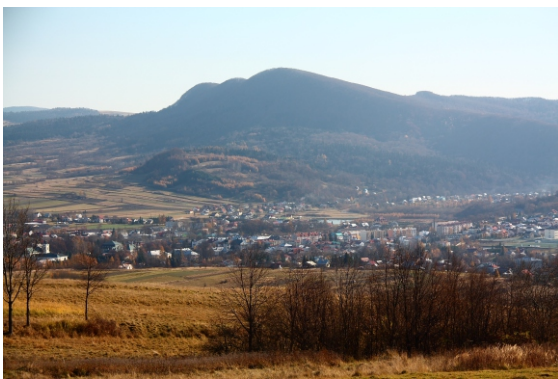
Cergowa - widok ze wzgórza Franków