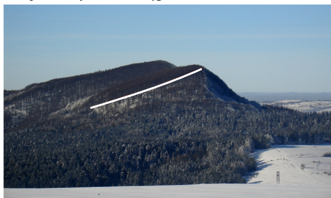
Cergowa od wschodu. Biała linia pokazuje nachylenie stoku południowego i warstw skalnych.

W obu wymienionych płaszczowinach mamy odmienne zespoły skalne: na Cergowej piaskowce cergowskie i margle podcergowskie, a u jej podnóża, już w granicach jednostki śląskiej, warstwy krośnieńskie. Piaskowce cergowskie są gruboławicowe, niebieskawe, ale po zwietrzeniu zmieniają kolor na żółtawy. Grubość kompleksu tych skał sięga około 300 m. Ich ławice