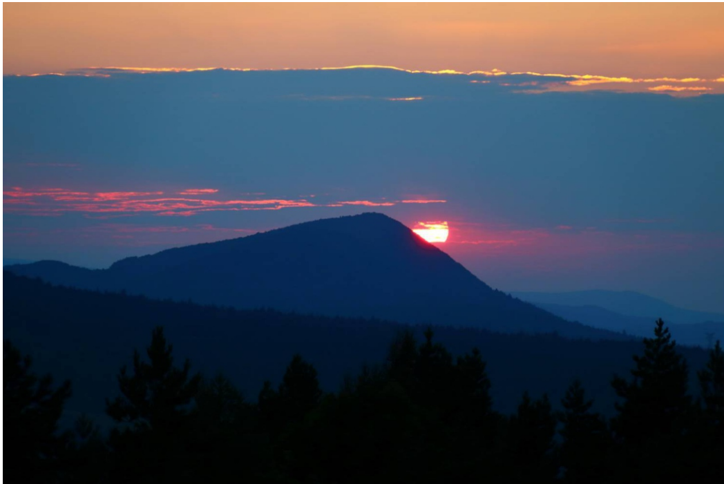
Cergowa spod Kiczery nad Wisloczkiem.

W okolicy Dukli znakomicie widać nasunięcie płaszczowiny dukielskiej na śląską. Stromy, północny stok Cergowej znajduje się w obrębie tej pierwszej,